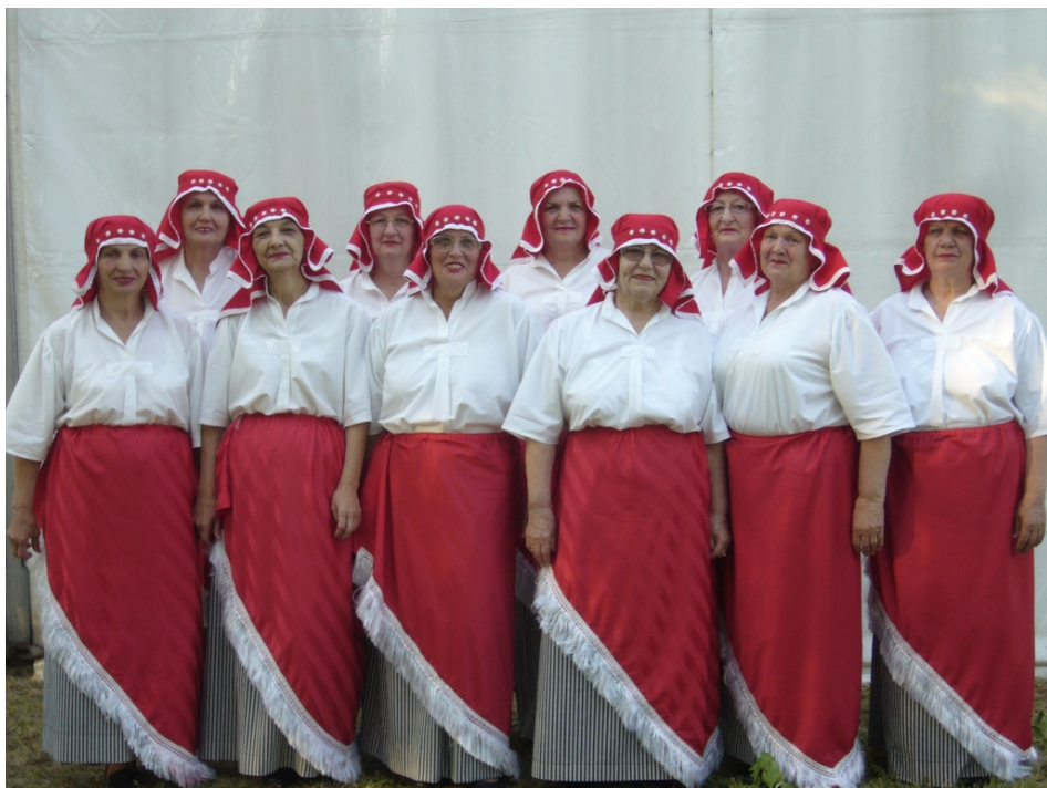
A dicsőséges csapat

Nyugdíjas Ki Mít Tud döntő Hajdúszoboszlón